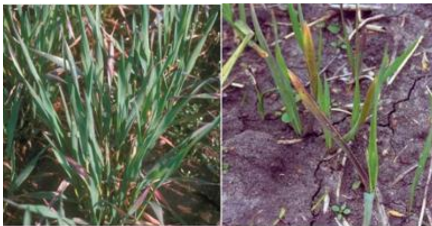
شکل ۲- کمبود فسفر

کمبود فسفر: مشخص‌ترین نشانه کمبود فسفر در مراحل اولیه رشد رویشی جو، کاهش توانایی رشد و تعداد پنجه است. گیاهان مبتلا به کمبود فسفر به رنگ سبز تیره و برگ‌های مسن در نوک و لبه‌ها به رنگ ارغوانی مایل به قرمز تغییر رنگ می‌یابند (شکل ۲). کلروز از نوک برگ پیر شروع شده و به طرف قاعده برگ گسترش می‌یابد، ولی قاعده برگ مانند سایر قسمت‌های گیاه سبز تیره باقی می‌ماند. برگ‌های جو مبتلا به کمبود فسفر دچار پیچیدگی شده و بعضی اوقات برگ‌های پیر، به دور برگ‌های جوانتر پیچ می‌خورند. گیاهان کوتاه مانده و ارتفاع بوته‌ها کاهش می‌یابند. کمبود فسفر، سبب تأخیر و نامنظمی در رسیدگی دانه و تولید خوشه‌های کوچک می‌شود.