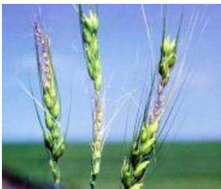
شکل ۱۴- خسارت سرمازدگی در نواحی مختلف خوشه جو- ممکن است همه گلچه ها همزمان دچار سرمازدگی نشوند.

توجه به تاریخ کاشت، انتخاب صبیح ارقام و تهیه بستر مناسب بذر از طریق کاشت بذر در بستری از کاه و کلش از جمله راههای مدیریت خسارت‌های ناشی از تنش سرما در جو می‌باشند.