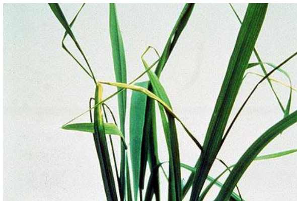
شکل ۹- کمبود مس

کمبود مس: اولین نشانه ظاهری کمبود مس در جو پژمردگی گیاه است که در اوایل پنجه دهی، حتی اگر رطوبت خاک در حد ظرفیت مزرعه باشد، پیش می آید (شکل ۹). اگر کمبود شدید باشد تاثیر آن روی میزان رشد پنجه ها تعیین کننده است. گیاهان در اثر کمبود مس رنگ روشن تری دارند. سوختگی نوک برگ های جوان اولین نشانه مشخص کمبود مس است. این حالت به طور ناگهانی باعث خشک شدن و پیچ خوردگی انتهای پهنک برگ شده و در مواقعی تا نصف طول برگ را فرا می گیرد، ولی قسمت پایین برگ تا زمان پیری طبیعی آن به رنگ سبز باقی می ماند.