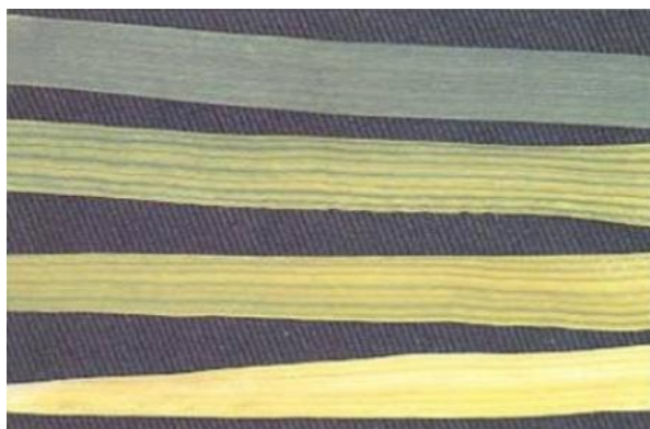
شکل ۷- کمبود آهن

کمبود منگنز: علائم کمبود منگنز در جو ابتدا در برگ‌های جوان آشکار می‌شوند که در مقایسه با برگ‌های پیر ظاهری زرد و پژمرده پیدا می‌کنند (شکل ۸). سپس لکه و نوارهای برنزی کم رنگی در قاعده جوان‌ترین برگ‌ها که کاملاً باز شده است ظاهر می‌گردد و در ادامه تمام طول برگ را می‌گیرد. کمبود شدید در مزرعه علاوه بر علائم مزبور، خشکی برگ‌های جوان را نیز نشان می‌دهد. کمبود منگنز را مانند کمبود آهن می‌توان در خاک‌های آهکی مشاهده نمود. در مقایسه با سرسبزی جو سالم، جو مبتلا به کمبود منگنز ظاهری رنگ پریده و افتاده‌تر دارد.