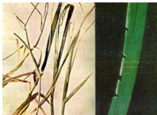
شکل ۱۰- کمبود بر