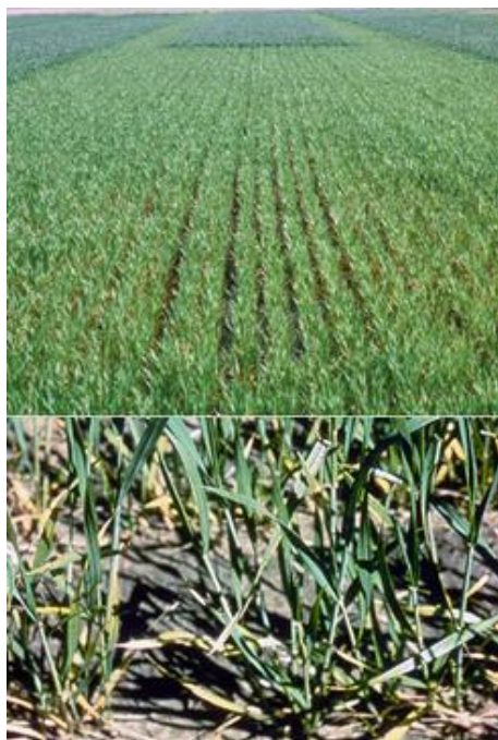
شکل ۱- کمبود نیتروژن

کمبود نیتروژن: کمبود نیتروژن معمول ترین و گسترده ترین کمبود عناصر غذایی در غلات دانه ریز است (شکل ۱). گیاهان مبتلا به کمبود نیتروژن رنگ پریده و زرد هستند. علائم اختصاصی کمبود نیتروژن ابتدا در مسن ترین برگ ها ظاهر میشود، در حالی که برگ های جوان نسبتاً سبز باقی می ماند. برگ های مسن تر نسبت به برگ های جوانتر کم رنگ تر شده و کلروز (زرد شدن برگ) ایجاد می گردد، که این کلروز تدریجاً در قاعده برگ به رنگ سبز روشن تبدیل خواهد شد. در مزرعه علائم، تقریباً همیشه به صورت قطعاتی به رنگ سبز روشن یا زرد ظاهر می گردند که در ادامه رشد گیاه کاهش یافته و ساقه ها نازک می شوند.