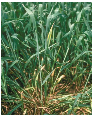
شکل ۳- کمبود پتاسیم

به برگ های جوان نیز منتقل می گردد. گیاهانی که شدیداً مبتلا به کمبود پتاسیم می شوند، ظاهری مشابه گیاهان دچار تنش خشکی را پیدا می کنند.