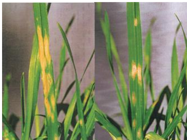
شکل ۶- کمبود روی

کوتاه ماندن گیاه و زردی شده و برگ‌ها به خاطر سوختگی در مرکزشان چین خورده می‌شوند. علائم کمبود روی در خاک‌های سبک و در خاک‌های آهکی مشاهده می‌شود.