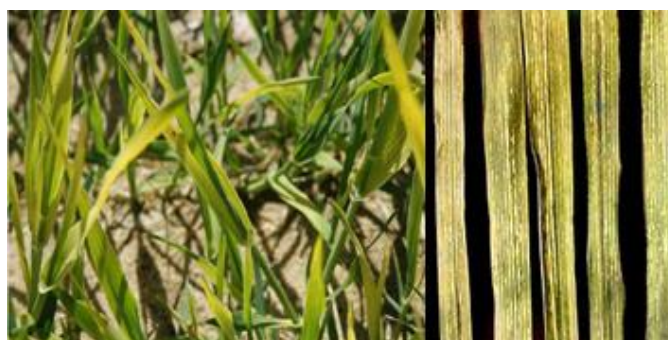
شکل ۸- کمبود منگنز

کمبود منگنز: علائم کمبود منگنز در جو ابتدا در برگ‌های جوان آشکار می‌شوند که در مقایسه با برگ‌های پیر ظاهری زرد و پژمرده پیدا می‌کنند (شکل ۸). سپس لکه و نوارهای برنزی کم رنگی در قاعده جوان‌ترین برگ‌ها که کاملاً باز شده است ظاهر می‌گردد و در ادامه تمام طول برگ را می‌گیرد. کمبود شدید در مزرعه علاوه بر علائم مزبور، خشکی برگ‌های جوان را نیز نشان می‌دهد. کمبود منگنز را مانند کمبود آهن می‌توان در خاک‌های آهکی مشاهده نمود. در مقایسه با سرسبزی جو سالم، جو مبتلا به کمبود منگنز ظاهری رنگ پریده و افتاده‌تر دارد.