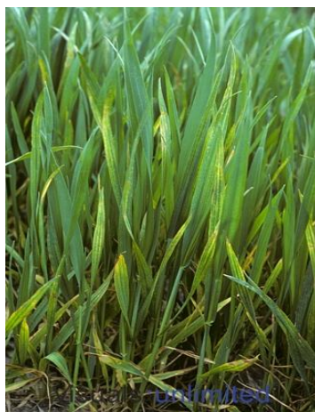
شکل ۵- کمبود منیزیم

کمبود منیزیم: علایم کمبود منیزیم در برخی موارد شبیه به کمبودهای پتاسیم و آهن است، اما از نظر محل قرار گرفتن علایم اولیه اختلاف فاحشی با کمبود پتاسیم دارد (شکل ۵). برخلاف کمبود پتاسیم، در کمبود منیزیم، برگ های جوان در مقایسه با برگ های پیر رنگ روشن تری دارند و این حالت شبیه کمبود آهن است. در ابتدا لکه های رنگ پریده به شکل دانه های تسبیح بین رگبرگ ها و لکه های نکروزه در نوک برگ ظاهر می شود. در ادامه، برگ ها زرد شده و کوچک می شوند. کمبود منیزیم در مزرعه جو عمومیت نداشته و بیشتر در خاک های سبک شنی مشاهده شود.