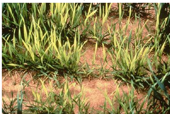
شکل ۴- کمبود گوگرد

کمبود گوگرد: از آنجایی که گوگرد در تشکیل کلروفیل گیاهان نیز دخالت دارد، لذا علائم کمبود آن در جو شبیه کلروز ناشی از کمبود نیتروژن (زردی عمومی برگ) است (شکل ۴). با این حال کمبود گوگرد برخلاف کمبود نیتروژن بیشتر در برگ های جوان دیده می شود. کمبود شدید گوگرد موجب عدم تشکیل خوشه می گردد.