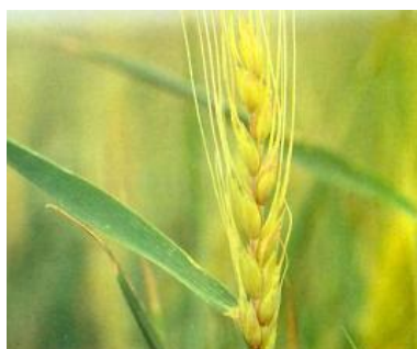
شکل ۱۳- خوشه سرمازده در جو- یخبندان موجب رنگ زرد و ظاهر نمناک پوسته دانه‌ها در خوشه شده است.